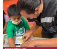
Mural en Arriesgar, La Nana