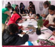
Tejiendo el Barrio