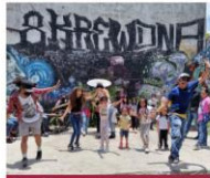
Bomba para Todos

Permanencia Centro Histórico /Actividades ACH-OSC: