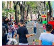
Clase "Del Tingo al Tango"