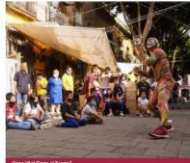
Clase "Del Tingo al Tango"