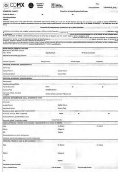
Ilustración 4 formato de VUT que se me entregó para realizar todo el trámite aquí descrito.

archivo, realizar yo la obtención de las copias simples y posteriormente pagar lo correspondiente a la certificación del documento. Donde se me señaló que era la única manera siempre y cuando, yo acreditara el interés jurídico total del condominio mediante la solicitud de la copia simple de las escrituras y la copia certificada u original de las escrituras, más una copia simple de mi INE, dándome como fecha límite el 31 de marzo del 2022 bajo el argumento comprobado de que se tiene que regresar el expediente al archivo general para esa fecha.