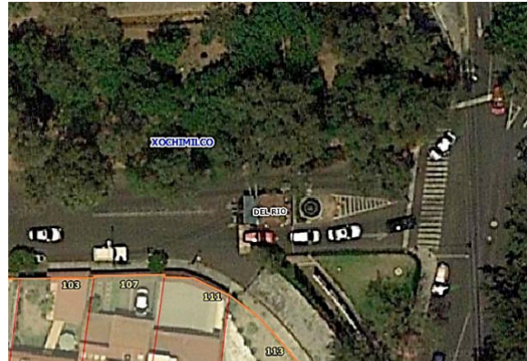
Calle Rincón del Río esquina Avenida San Lorenzo, NO se aprecia número asignado.

Por lo anterior, dicha Dirección General, se ve imposibilitada en proporcionar información relativa de cómo se les distribuye agua potable a dichas casetas.