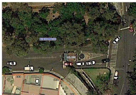
Calle Rincón del Río esquina Avenida San Lorenzo, NO se aprecia número asignado.

Por lo anterior, dicha Dirección General, se ve imposibilitada en proporcionar información relativa de cómo se les distribuye agua potable a dichas casetas.