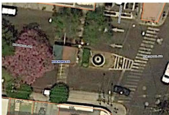
Calle Rincón del Sur esquina Avenida San Lorenzo, NO se aprecia número asignado.