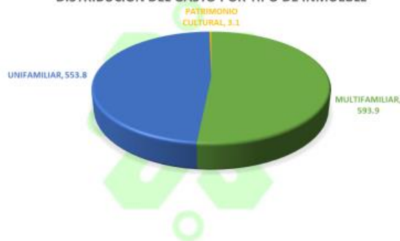
DISTRIBUCIÓN DEL GASTO POR TIPO DE INMUEBLE