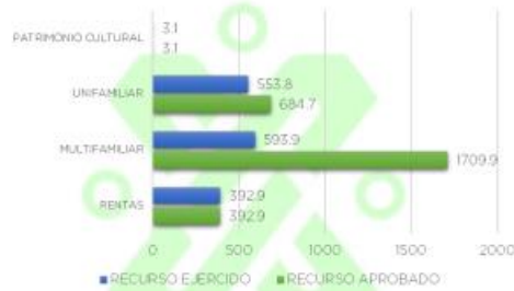
RECURSO APROBADO VS RECURSO EJERCIDO