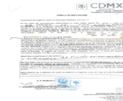
Cédula de notificación