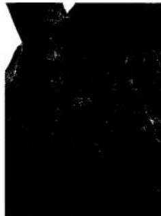
Ficus elástica, evidencia de enfermedad en tronco, causada por bacteria posiblemente del género Erwinia