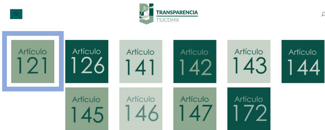
Imagen representativa https://www.poderjudicialcdmx.gob.mx/transparencia/art-121/

Lo anterior resulta relevante debido a que, al acceder a las 3 direcciones electrónicas remitidas y seguir las indicaciones precisadas en la respuesta es posible advertir en todas ellas el directorio con nombre, cargo y correos electrónicos de todas las personas titulares de las Direcciones, Direcciones Ejecutivas, Direcciones Generales y Jefaturas de Departamento que conforman al sujeto obligado :