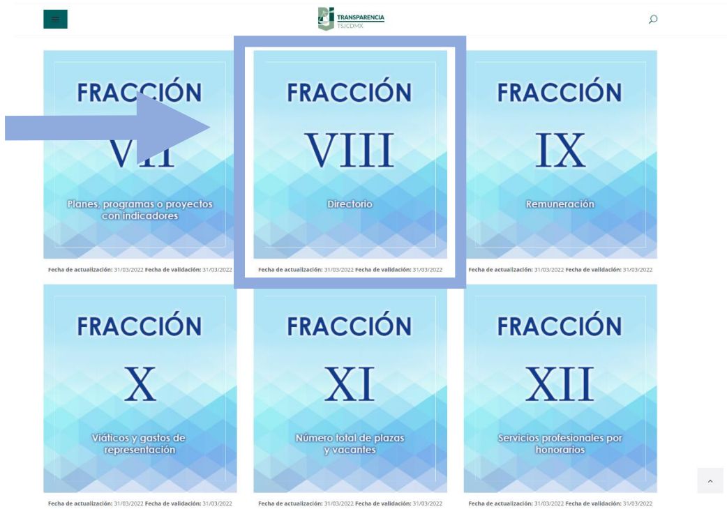
Imagen representativa https://www.poderjudicialcdmx.gob.mx/