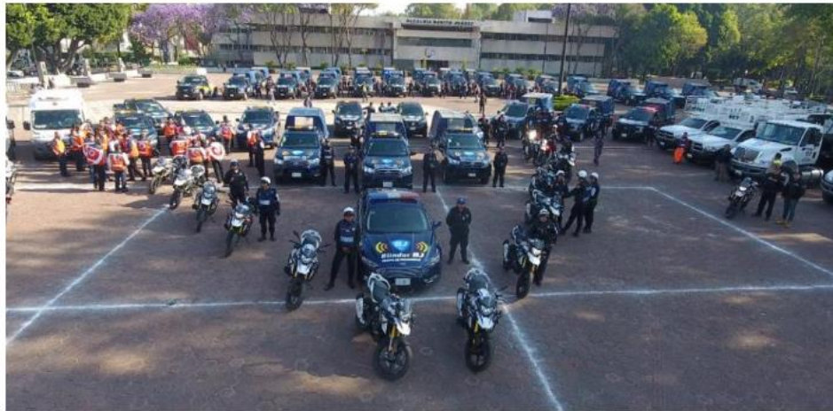
Todas las patrullas del Equipo de Proximidad #BlindarBJ tienen un teléfono asignado para atender oportunamente las emergencias.

También, en los medios y redes sociales existen información respecto al programa Blindar BJ promovido por el propio Alcalde de Benito Juárez: