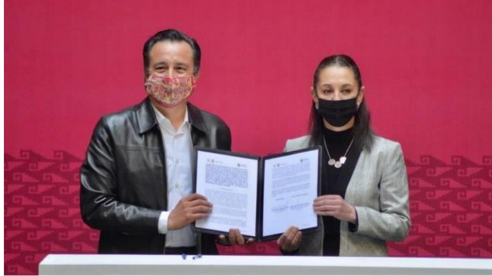
FOTO DIFUNDIDA POR COMUNICACIÓN SOCIAL DEL GOBIERNO DEL ESTADO DE VERACRUZ, DISPONIBLE EN EL ENLACE

http://www.veracruz.gob.mx/2022/01/16/veracruz-y-ciudad-de-mexico-firman-convenio-para-el-desarrollo-de-proyectos-de-innovacion-en-diferentes-areas-de-gobierno/