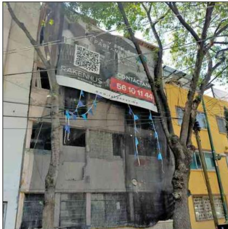
▲ La inmobiliaria Rakennus comenzó la venta irregular de departamentos en la calle Tuy número 41, colonia Postal.