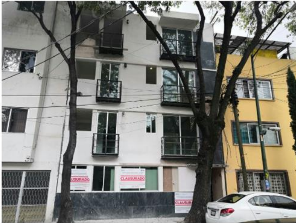
Los propietarios del edificio de departamentos ubicado en Tuy 45 construyeron un tercer nivel, a pesar de que el lugar resultó con daños por el sismo de 2017; en la imagen se aprecian sellos de clausura con fecha 11 de agosto de 2022.

Elba Mónica Bravo y Sandra Hernández García Tiempo de lectura: 3 min.