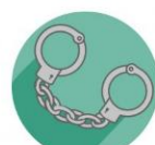
EJECUCIÓN de sanciones