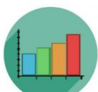
INDICADORES de Resultados