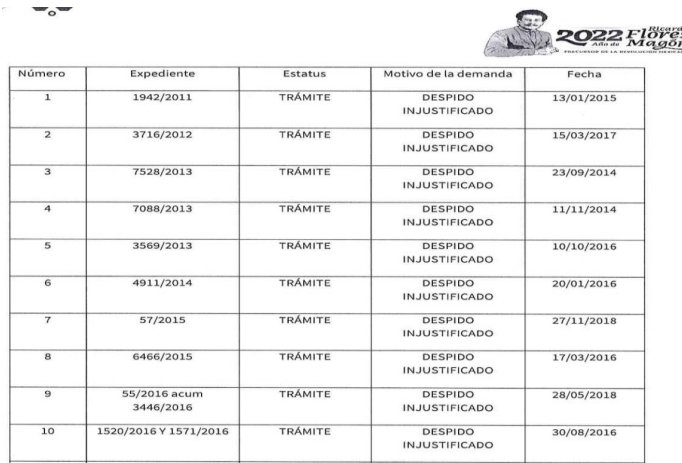
Imagen solo para ejemplificar.

Respecto a: Cuántos y Cuáles juicios laborales tiene el Organismo Regulador de Transporte, estatus, se indique el motivo (despido injustificado, despido justificado, renuncia, rescisión de contrato, terminación de contrato) y fecho se informa que hasta al mes de agosto de 2021 se tenían 30 juicios laborales en trámite, los cuales se enlistan a continuación: