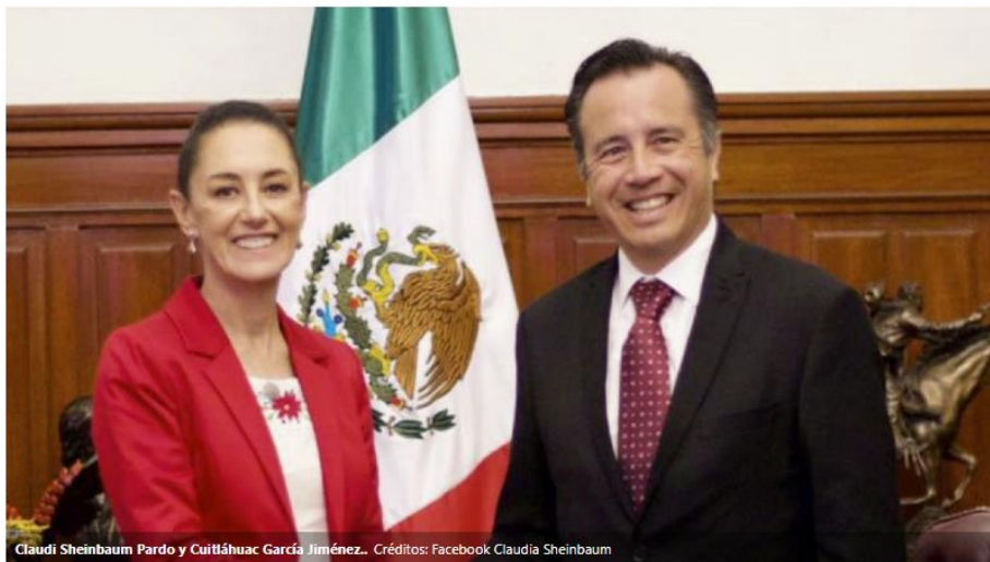
Claudi Sheinbaum Pardo y Cuitláhuac García Jiménez..

La jefa de gobierno de la Ciudad de México, Claudia Sheinbaum, se reunió con el gobernador de Veracruz, Cuitláhuac García, y otros funcionarios públicos del estado; los mandatarios comenzaron el convenio en enero de este año para iniciar el proyecto