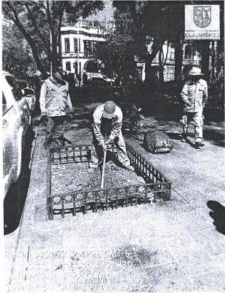
Plantación Santa María la Ribera 1 árbol de especie Magnolia.