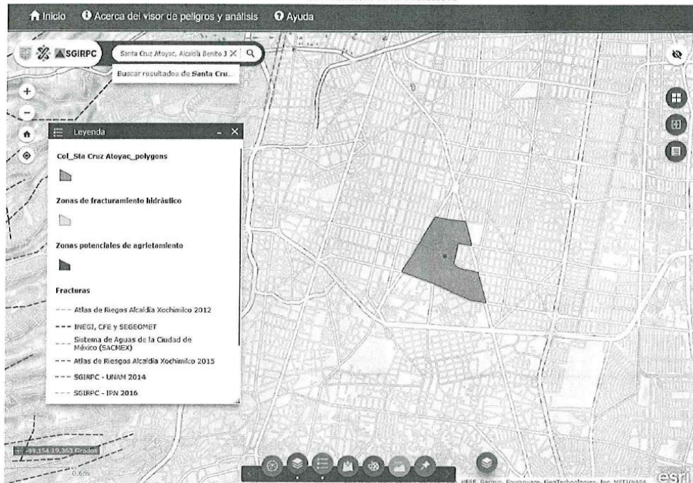
Imagen 01. Imagen del módulo de consulta pública Análisis de exposición, del Atlas de Riesgos de la Ciudad de México, donde se encuentra la información del fenómeno perturbador fracturamiento.

SECRETARÍA DE GESTIÓN INTEGRAL DE RIESGOS Y PROTECCIÓN CIVIL DIRECCIÓN GENERAL DE ANÁLISIS DE RIESGOS DIRECCIÓN DE ALERTAS TEMPRANAS COORDINACIÓN DE ATLAS DE RIESGOS