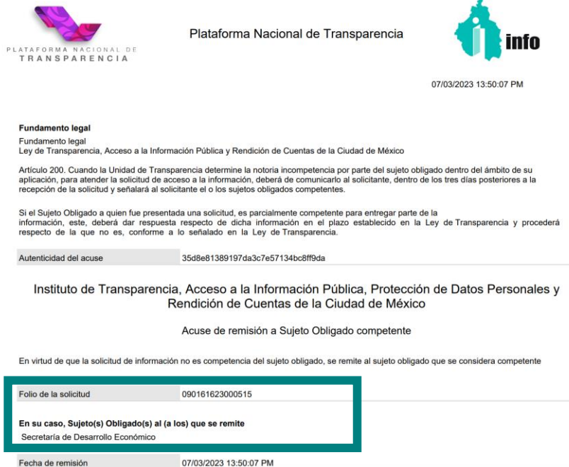
Imagen representativa del Acuse de remisión a Sujeto Obligado competente emitido por la plataforma

Como respuesta, el sujeto obligado informó que no contaba con competencia alguna relacionada con la información de interés y, por lo tanto, no la genera, detenta o administra. Sin embargo, precisó que, de acuerdo con la Ley Orgánica del Poder Ejecutivo y de la Administración Pública de la Ciudad de México, se tiene la potestad para delegar las facultades que originalmente le corresponden a la persona titular de la Jefatura de Gobierno. Y detalló que, las atribuciones de coordinar, normar y supervisar la operación y funcionamiento de la Central de Abasto de la Ciudad de México, a través de la Coordinación General de la Central de Abasto, es de la Secretaría de Desarrollo Económico, razón por la cual, fue remitida la solicitud a través de la plataforma a su Unidad de Transparencia.