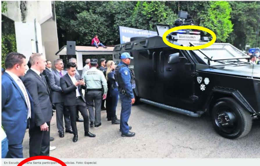
En Escudo Cuajimalpa participan 500 policías.

En la representación del Viacrucis se desplegarán 500 policías: Rubalcava