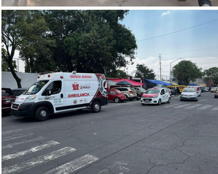
Iztacalco, Ciudad de México a 19 de abril de 2023

Dicha información puede ser consultada en la siguiente liga: http://www.iztacalco.cdmx.gob.mx/inicio/index.php/notasportada/proteccion-civil