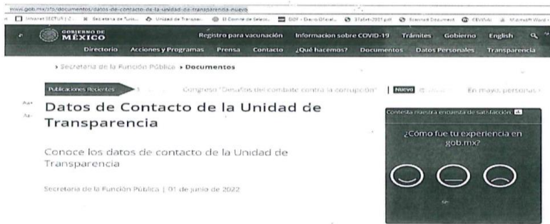
(Se adjunta evidencia de que la liga de internet proporcionada se encuentra activa al día de hoy)