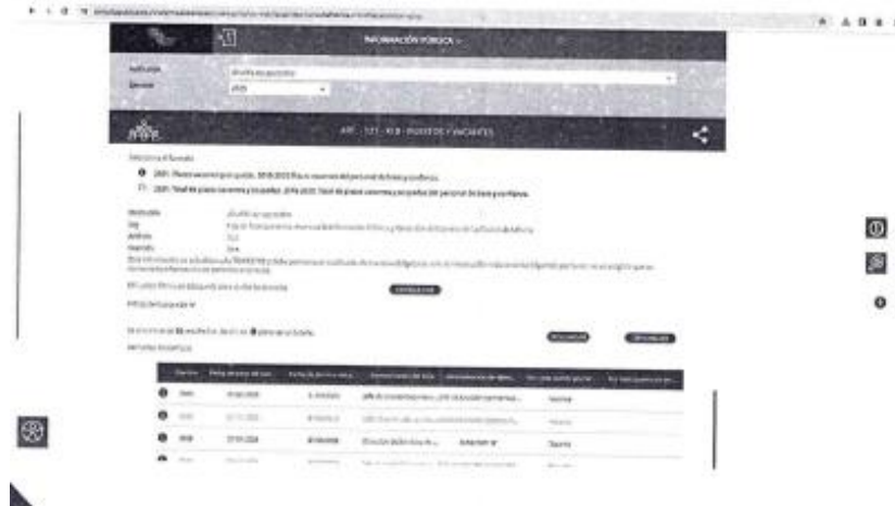
FORMATO 11 B

Del mismo modo, en el Sistema de Portales de Transparencia de la Plataforma Nacional de Transparencia, como se aprecia en las siguientes capturas de pantalla: