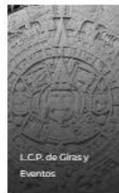
L.C.P. de Giras y Eventos