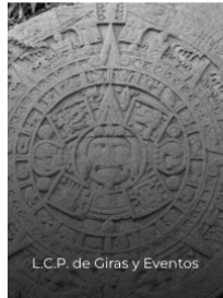
L.C.P. de Ciras y Eventos

Si bien en la etapa de alegatos se pronunció por el inciso a) y c) del numeral 1, no remitió dicha información a quien es recurrente.